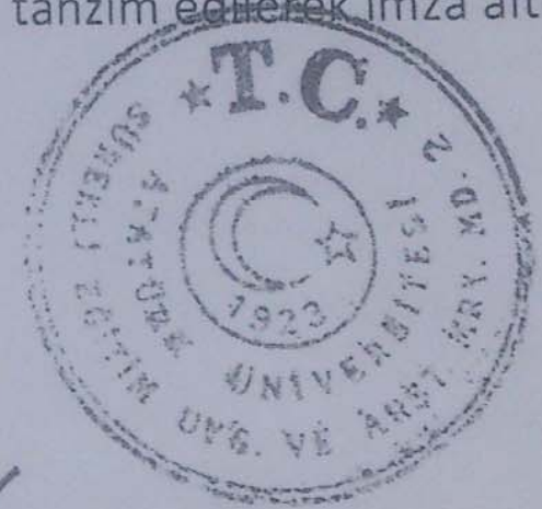
YAŞAM BOYU EĞİTİMİ DESTEKLEME DERNEĞİ BAŞKANI

İşbu protokol 10 (on) maddeden ibaret olup, ATASEM ile YBEDD tarafından okunup anlaşıldıktan sonra 28/02/2013 tarihinde 2 (iki) nüsha olarak tanzim edilerek imza altına alınmıştır.