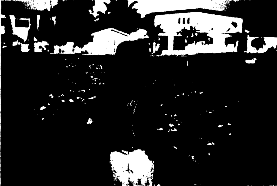
Şekil 1. Gana’da atıksu ile sulama

Ancak nitrat miktarları çok yüksek olan geri kazanım suları bitki gelişimine engel teşkil edebilmektedir. Ayrıca, sürekli geri kazanım sularıyla sulanan topraklarda tuzlanma, çözülmüş katıların ve ağır metallerin birikmesi gibi sorunlar oluşabilmektedir. Bu nedenle bu suların sulamada kullanımında toprak kalitesine ve sulanacak bitki türüne göre sulama yapılması önem taşımaktadır. Geri kazanım suları çoğunlukla yem bitkilerinin, lifli bitkilerin, sınırlı olmakla birlikte orkide bahçelerinin ve üzüm bağlarının sulanmasında kullanılmaktadır.